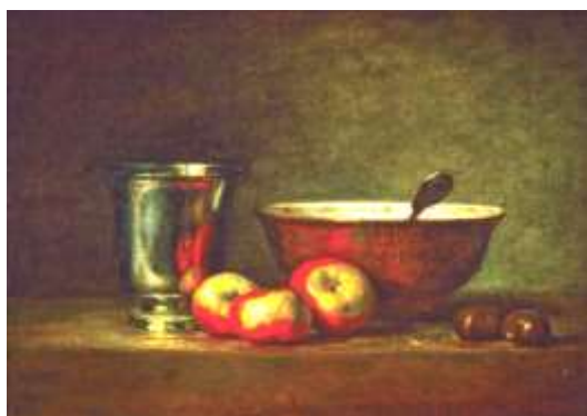
Ж.Шарден. Серебряный кубок

Перед Вами реалистический натюрморт, попробуйте, используя представленные предметы обобщить их до степени декоративного натюрморта и рядом нарисовать свой натюрморт