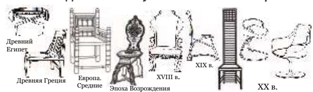
Мебель. Развитие во времени от Древнего Египта до XX в.,