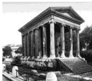
Святилище Фортуны Первороденной