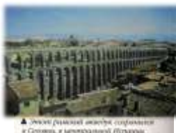
▲ Элемент римской архитектуры: колоннада в Септимии, в императорской Италии.