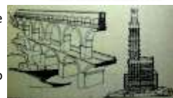
Акведук Аппия Клавдия