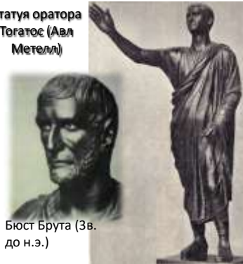
Бюст Брута (3 в. до н.э.)