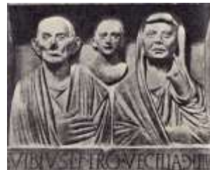
Надгробная стела Вибия и его семьи