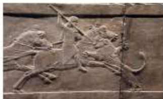
«Большая львиная охота». Рельеф из дворца Ашшурбанипала в Ниневии