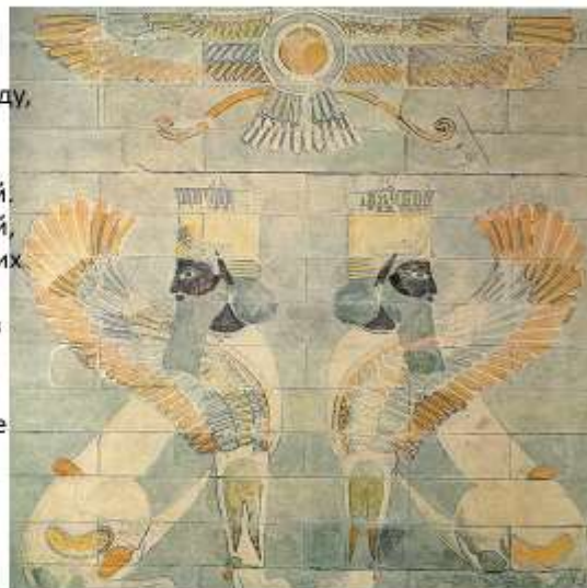
Шеду. Панно из дворцового комплекса в Сузах. Глазурованный кирпич.