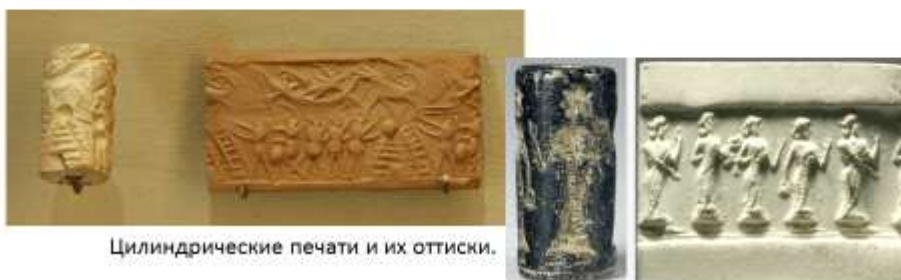
Цилиндрические печати и их оттиски.