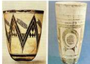
Сосуды из Суз 4 тыс. до н.э.