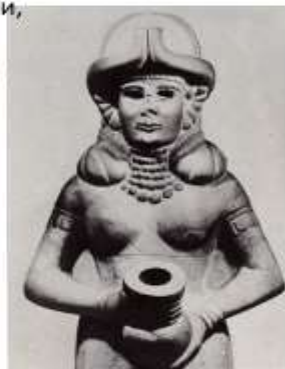
Статуя богини Иштар. 18 в. до н.э. Обладала священным даром источать в знойный день прозрачную воду.

Статуя лишена скованности и столбообразной монументальности статуй предшествующих веков.