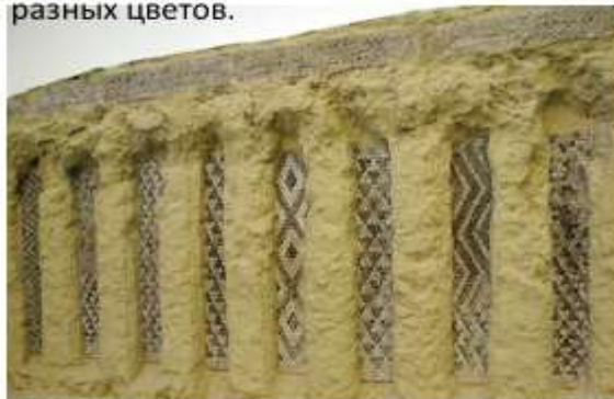
«Красное здание» в Уруке. 4тыс. до н.э.