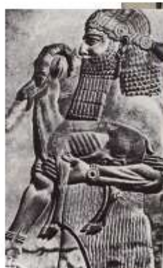
Царь Саргон II, несущий жертвенного козленка. Фрагмент рельефа из дворца в Дур-Шаррукине