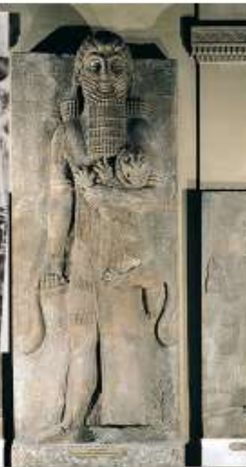
Рельеф с изображением Гильгамеша из дворца Саргона II в Дур- Шаррукине