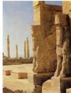
Ворота царя Ксеркса в Персеполе.