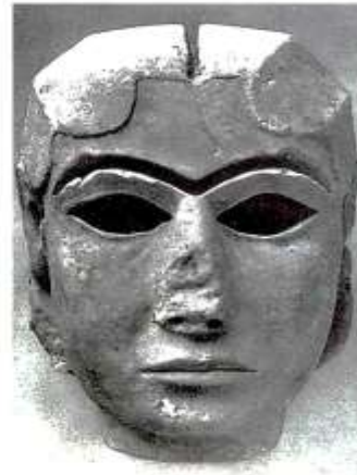
Голова богини Инанны из Урука. Нач. 3-го тыс. до н. э.