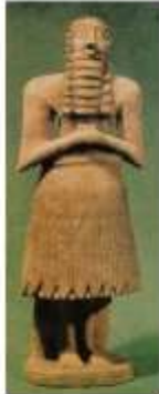
Статуя шумерийского бога Аб-У (Абзу-мировой океан). Сер. 3-го тыс. до н.э.