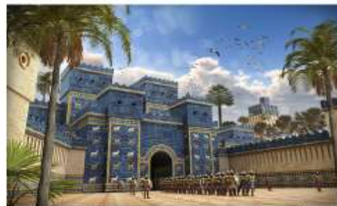
Ворота Иштар в Вавилоне и дорога процессий. Реконструкция