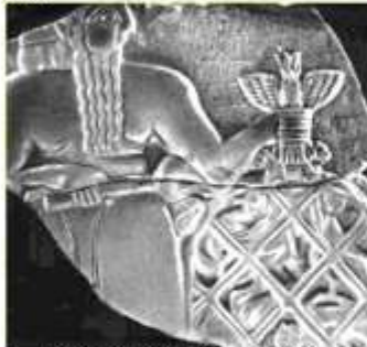
Стела царя Эаннатума (стела коршунов)

Стелы — каменные плиты разных размеров, имеющие закругленную верхнюю часть и изображения с исторической или религиозной тематикой.