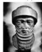
Голова царя Хаммурапи