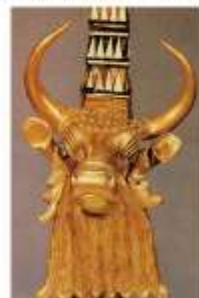
Голова быка. Навершие резонатора арфы из царской гробницы в Уре. Середина 3-го тыс. до н.э.