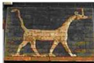
Рельефные изображения священных животных бога Мардука — быка и фантастического существа мушруша.