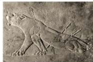
Раненные лев и львица