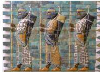
Рельеф с изображением царской гвардии

Оформление задней стены северного фасада — выложенные изразцами фигуры крылатых быков — напоминает ворота богини Иштар в Вавилоне