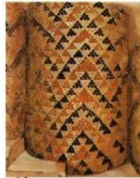
Облицовка полуколонн «Красного здания» в Уруке

Арка – криволинейное перекрытие между двумя опорами