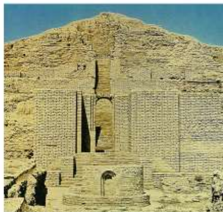
Зиккурат в Чога-Замбиле. 13в. до н.э.