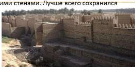
Стены дворца Навуходоносора II