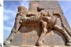
Шеду из Персеполя