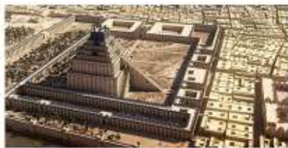
Зиккурат Этамэнанки. Реконструкция