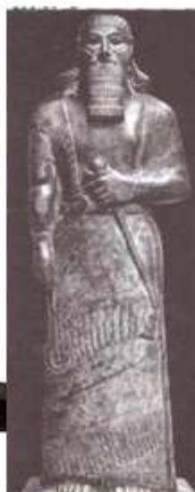
Статуя царя Ашшурнасирапала II.