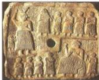
Храмовый рельеф. Шумер. 3 тыс. до н.э.

Анзунд здесь как символ власти божества над всеми обитателями лесистых гор и долин.