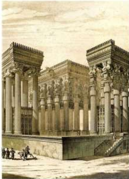
Гипостильный зал царского дворца в Персеполе. Реконструкция