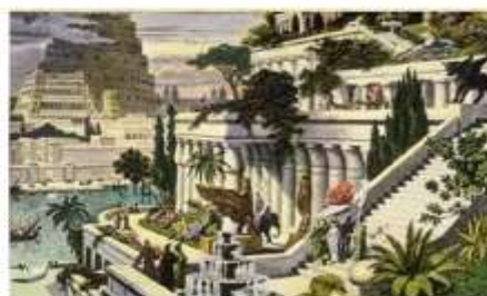
Висячие сады Семирамиды. Реконструкция.

В центральной части Вавилона высились дворцы царя Навуходоносора II – «северный» и «южный». На террасах одного из них были посажены знаменитые «висячие сады» Семирамиды , считавшиеся одним из чудес света. Согласно легенде, Семирамида, жена Навуходоносора была родом из далекой цветущей Мидии и очень скучала по дому. Именно для неё, царь приказал разбить роскошные сады из различных экзотических растений, цветов и деревьев. Специально для этого была разработана уникальная система подачи воды на каждую из террас. В условиях жаркого сухого климата такие сады, действительно казались чудом.