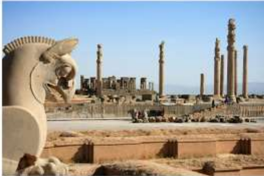
Персеполь. Руины царского дворца

Изучая и заимствуя чужие традиции, они тем не менее сумели создать свою собственную художественную систему, которая получила название «имперского стиля». Ахеменидское искусство было придворным, предназначенным символизировать и прославлять могущество и величие государства и царской власти. Ему присущи торжественность, масштабность, строгая ритмичность композиции.