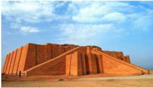
Зиккурат в Уре. 3 тыс. до н.э.