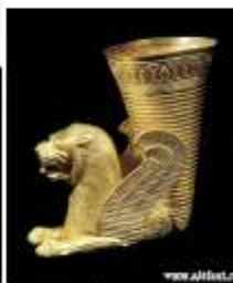
Золотые сосуды в форме рога