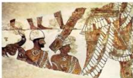
Жертвоприношение. Фрагмент фрески из дворца в Мари. 1-я пол. 2 тыс. до н.э.

Дворец правителя Мари Зимрилыма представлял собой большое здание, включавшее 138 помещений, занимавших площадь в 1,5 га. Стены интерьеров дворца были украшены росписями изображавшими сцены сбора фиников, культовые и триумфальные сцены.