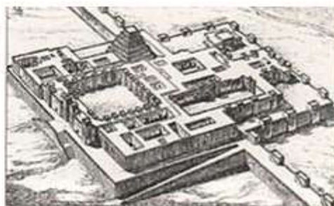
Город Дур-Шаррукин. Реконструкция

Примером такого города может служить Дур-Шаррукин (совр. Хорсабад, Ирак) — резиденция царя Саргона II (722—705 гг. до н.э.). Обнесенный стенами с башнями, он представлял собой прямоугольник площадью в 28 га. Больше половины общей площади города занимал дворец (10 га), возведенный на высокой платформе. Его окружали мощные стены высотой в 14 метров. В системе дворцовых перекрытий применялись своды и арки. В стене были семь проходов (ворот).