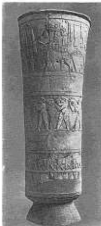
Культурный сосуд из храма богини Инанны в Уруке. Нач. 3-го тыс. до н.э.