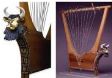
Арфы из царской гробницы в Уре