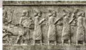
Рельеф с изображением данников на стене лестницы дворца в Персеполе

• В ападану вели широкие лестницы с двух сторон. Их простенки были украшены рельефами , изображающими шествие данников к царю. Среди изображённых – воины, слуги, представители побеждённых народов и стран, и все они словно «поднимаются» вместе с реальными посетителями к подножью трона великого властителя.