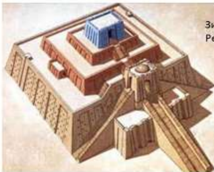
Зиккурат в Уре. Реконструкция

посвящен богу Нанне, относится ко времени расцвета шумерского царства Ег. нижняя платформа поражает своими размерами – 65 на 43 м, высотой около 20 м. Согласно многочисленным реконструкциям, общая высота этого зиккурата изначально могла достигать 60 м.