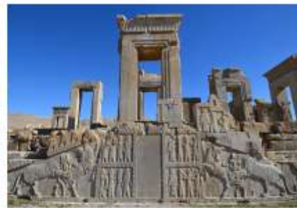
Царский дворец в Персеполе