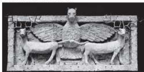
Анзунд, когтящий оленей. Рельеф из Эль-Обейда. Около 2600 г. до н. э.

Нередко в рельефах встречаются изображения фантастических персонажей и гибридных существ: орел с головой льва – Анзунд (или Имдугуд), человек с головой, ногами и хвостом быка