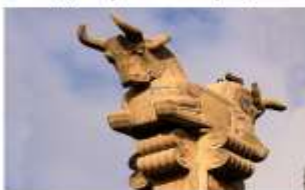
Капитель колонны из дворца в Персеполе

• В ападану вели широкие лестницы с двух сторон. Их простенки были украшены рельефами , изображающими шествие данников к царю. Среди изображённых – воины, слуги, представители побеждённых народов и стран, и все они словно «поднимаются» вместе с реальными посетителями к подножью трона великого властителя.