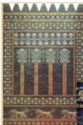
Реконструированный фрагмент облицовки стены тронного зала