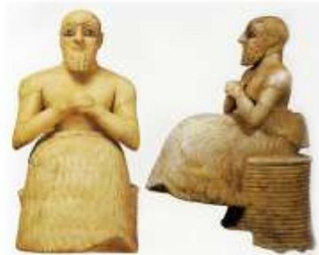
Адорант чиновника Эбих-иля из Мари. 3 тыс. до н.э.