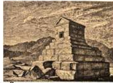
Гробница Кира Великого в Пасаргадах.