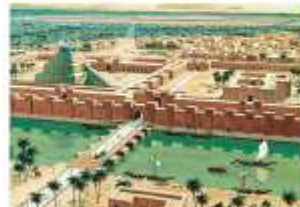
Древний Вавилон. Реконструкция