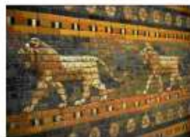
Реконструированный фрагмент облицовки Дороги процессий

Недалеко располагался величественный зиккурат Этамэнанки (архитектор Арадаххэшу ). Он состоял из 7 ступеней, окрашенных в разные цвета, его высота составляла более 90 метров. На самой вершине зиккурата находился небольшой храм Мардука , облицованный голубой глазурованной керамической плиткой, а над его крышей были водружены позолоченные рога быка – священного животного бога Вавилона - символ плодородия.