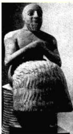
Статуя сановника Эбих-Иля из Мари