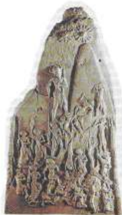
Стела царя Нарам-Суэна Конец 3-го тыс. до н.э.

В период правления царя Нарам-Суэна (Нарам-Сина) (2254—2218 гг. до н. э.) аккадская империя достигла своего расцвета. Нарам-Суэн был внуком Саргона, основателя империи, и четвертым правителем династии.