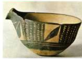
Чаша из Убайда 4 тыс. до н.э.