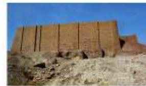
Зиккурат в г. Уре. XXII в. до н.э.

Цвет (свой для каждой из платформ) имел не только эстетическое, но и символическое значение. Распределение цветов было от тёмных внизу до самых светлых и «сияющих» наверху.