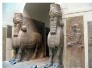
Шеду из дворца Саргона II в Дур-Шаррукине

Великолепным был дворец царя Саргона II в Дур-Шаррукине , занимавший большую часть всего города. Он был возведен на высокой платформе, на которую вели пандусы такой ширины, что по ним легко перемещались колесницы. Стены дворца были украшены цветными изразцами — керамическими плитками.