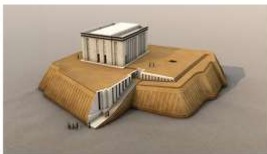
"Белый храм" в Уруке. 3 тыс. до н.э. Реконструкция

Каждому из божеств посвящался свой храм, который становился центром города-государства.