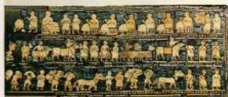
«Штандарт из Ура» с изображением битвы, пригона добычи и пиршества по случаю победы. Сер. 3-го тыс. до н.э.