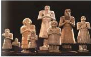
Адоранты - храмовая скульптура Шумера. 3 тыс. до н.э.