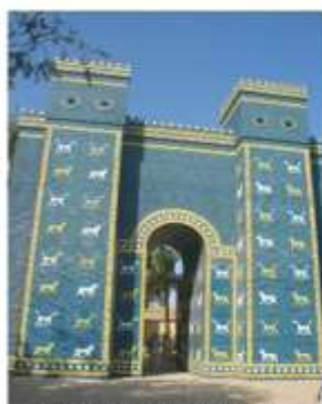
Ворота богини Иштар