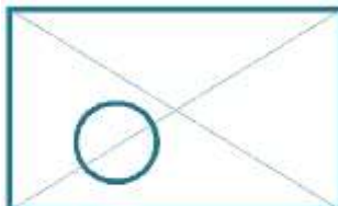
Сюжетно-композиционный центр на переднем плане