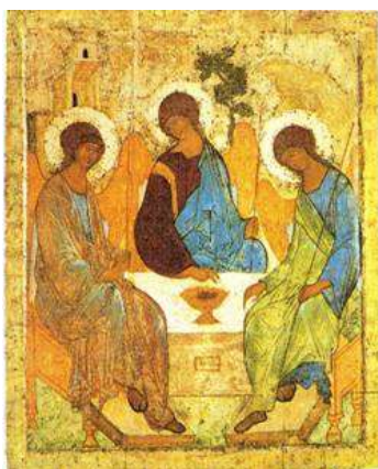
А.Рублев. Троица Ветхозаветная