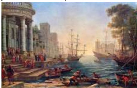
Клод Лоррен «Отплытие святой Урсулы»