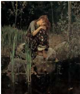
В. М. Васнецов Аленушка