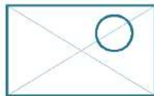
Сюжетно-композиционный центр на дальнем плане