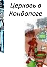
Церковь в Кондопоге