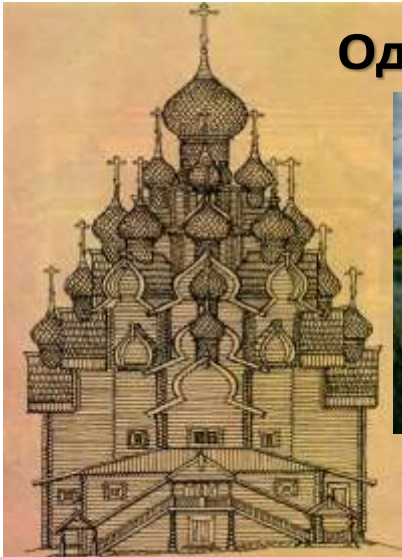
Многоглавая Преображенская церковь в Кижях