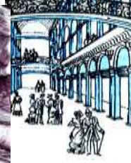
ГУМ в Москве