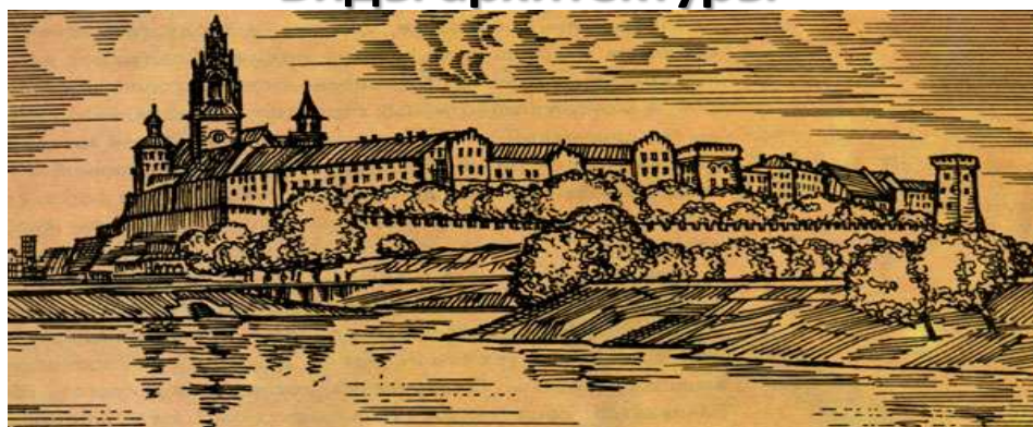
Вавельский замок гордо возвышается над древним польским городом Краковом