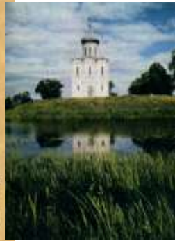
Церковь Покрова на Нерли