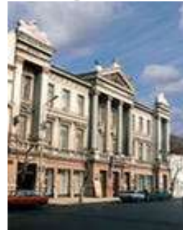
Лувр. Париж. Франция