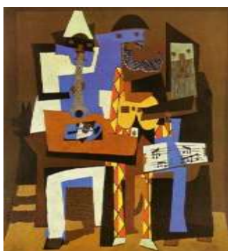
П.Пикассо. Три музыканта

Кубизм – авангардистское течение в изобразительном искусстве 1 четверти 20 века. Характеризуется плоскостным изображением, разложенным на множество простых форм (куб, конус, цилиндр), геометрических фигур. Основной идеей кубизма было отрицание трехмерной реальности.