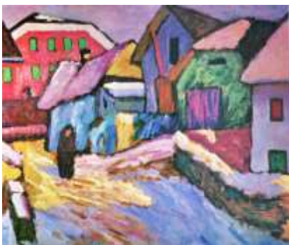
Г.Мюнтер. Солнечные блики на снегу

2. Перед Вами картина Г.Мюнтера «Солнечные блики на снегу», создайте ее интерпретацию