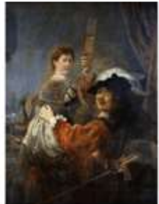
Произведения – репродукции картины Рембрандта «Автопортрет с женой»