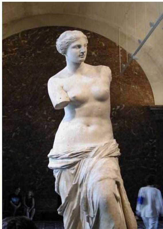
«Афродита Милосская» скульптор Агесандр