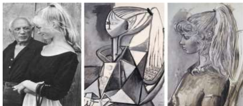
Пабло Пикассо с моделью и ее портреты в стиле кубизм и реализм