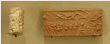
Цилиндрическая печать и оттиск. Месопотамия