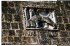
Герб рыцаря ордена иоаннитов, Мальта