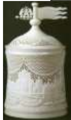
Шкатулка -Великий Новгород-Резьба по кости. Холмогоры