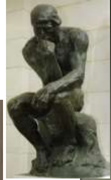
О.Роден. Мыслитель (бронза)