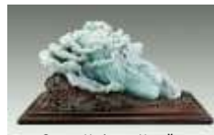
Салат. Нефрит. Китай