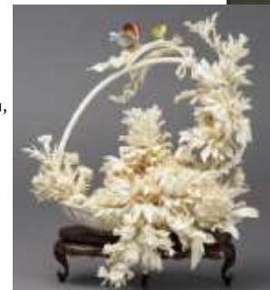
Цветы. Китайская резьба по кости