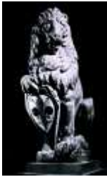
Донателло. Геральдический лев Марзокко папы Мартина V (камень известняк).