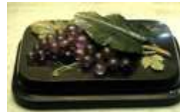
Пресс-папье. Виноград. Камень. Екатеринбург.