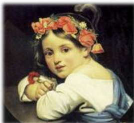
Девочка в мановом венке (1816)