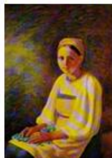
Крестьянка с васильками.