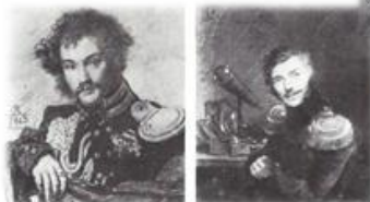
Портреты М.Ланского, неизвестного (1813)