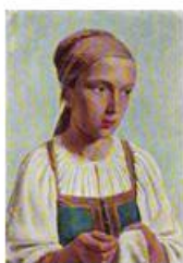
Крестьянская девушка за вышиванием