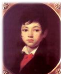
Портрет А.А.Челищева (1809)