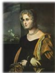
Портрет Е.С.Авдулиной (1822)

В 1827г. Кипренский создает портрет А.С.Пушкина, по заказу А.А.Дельвига – это одно из лучших прижизненных изображений поэта.