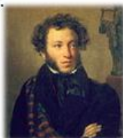
О.Кипренский. Портрет А.С.Пушкина (1827)

Современники считали, что сходство портрета с подлинником было поразительным.