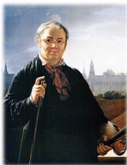
Автопортрет на фоне окна с видом на Кремль (1844)

Мастер портретно-бытового жанра с элементами сентиментальности.