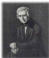
Г.Сорока. Портрет А.Г.Венецианова

В 1818 году вышел в отставку переехал в имение своей жены село Сафонково Тверской губернии. Стал работать в бытовом жанре. Поэтически передавал сцены деревенской жизни и крестьянского труда.