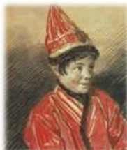
Калмычка Баяуста (1813)