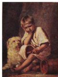
Вот-те и батькин обед! (1824).