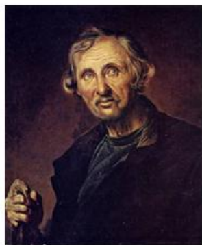
В.А.Тропинин. Странник. (1847)

Василий Андреевич Тропинин был самым плодовитым(около 3000 портретов) и одним из наиболее одаренных русских портретистов.