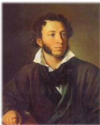
В.Тропинин. Портрет А.С.Пушкина (1827)

В.А.Тропинин считался лучшим художником Москвы. Писал много заказных портретов.