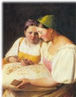
А.Г.Венецианов. Гадание на картах.

А.Г. Венецианов занимался педагогической деятельностью, разработал свою методику рисования с натуры и на пленере, что вызывало недовольство консервативных профессоров Академии. Из его мастерской в Петербурге и в Сафонкове вышли десятки молодых художников. Это А.В.Тыранов, братья Н.Г.и Г.Г.Чернецовы, А.А.Алексеев, Е.Ф.Крендовский, Л.К.Плахов, Г.В.Сорока.