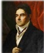
Портрет В.С. Хвостова 1814