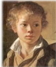
Портрет А.В. Тропинина