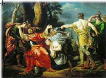
Дмитрий Донской на Куликовом поле.