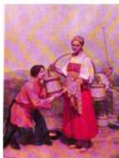
Встреча у колодца (1843).